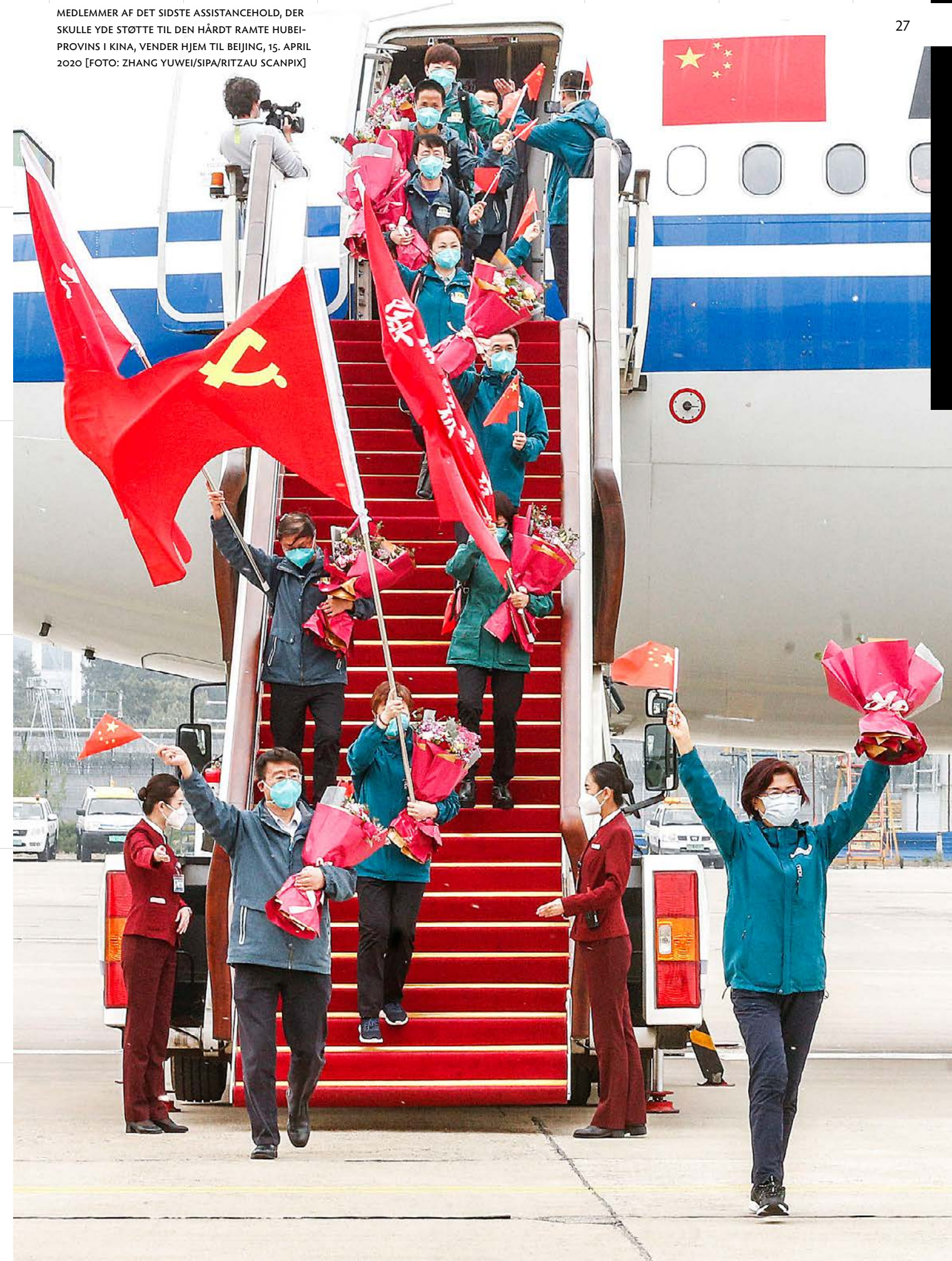
MEDLEMMER AF DET SIDSTE ASSISTANCEHOLD, DER SKULLE YDE STØTTE TIL DEN HÅRDT RAMTE HUBEI-PROVINS I KINA, VENDER HJEM TIL BEIJING, 15. APRIL 2020

Her er det tydeligt, at nordeuropæerne fortsat ikke har forstået, at vi – på godt og ondt – har bundet os sammen i et skæbnefællesskab med Sydeuropa. En hård kerne af lande i Nordeuropa – Holland, Tyskland, Østrig samt Finland – er hårdnakkede modstandere mod idéen om såkaldte euro- eller coronabonds. Sådanne eurobonds ville udstedes som statsobligationer på finansmarkederne – præcis som normale statsobligationer. Den eneste forskel ville være, at eurozonelandene samlet ville dække for udstedelsen af obligationerne. Det ville betyde, at lande som Italien, Grækenland og Spanien ville kunne låne til billigere rater på finansmarkederne – og vigtigere, det ville skabe et incitament til at skabe en fælles eurozoneøkonomi, ikke blot en pengepolitisk