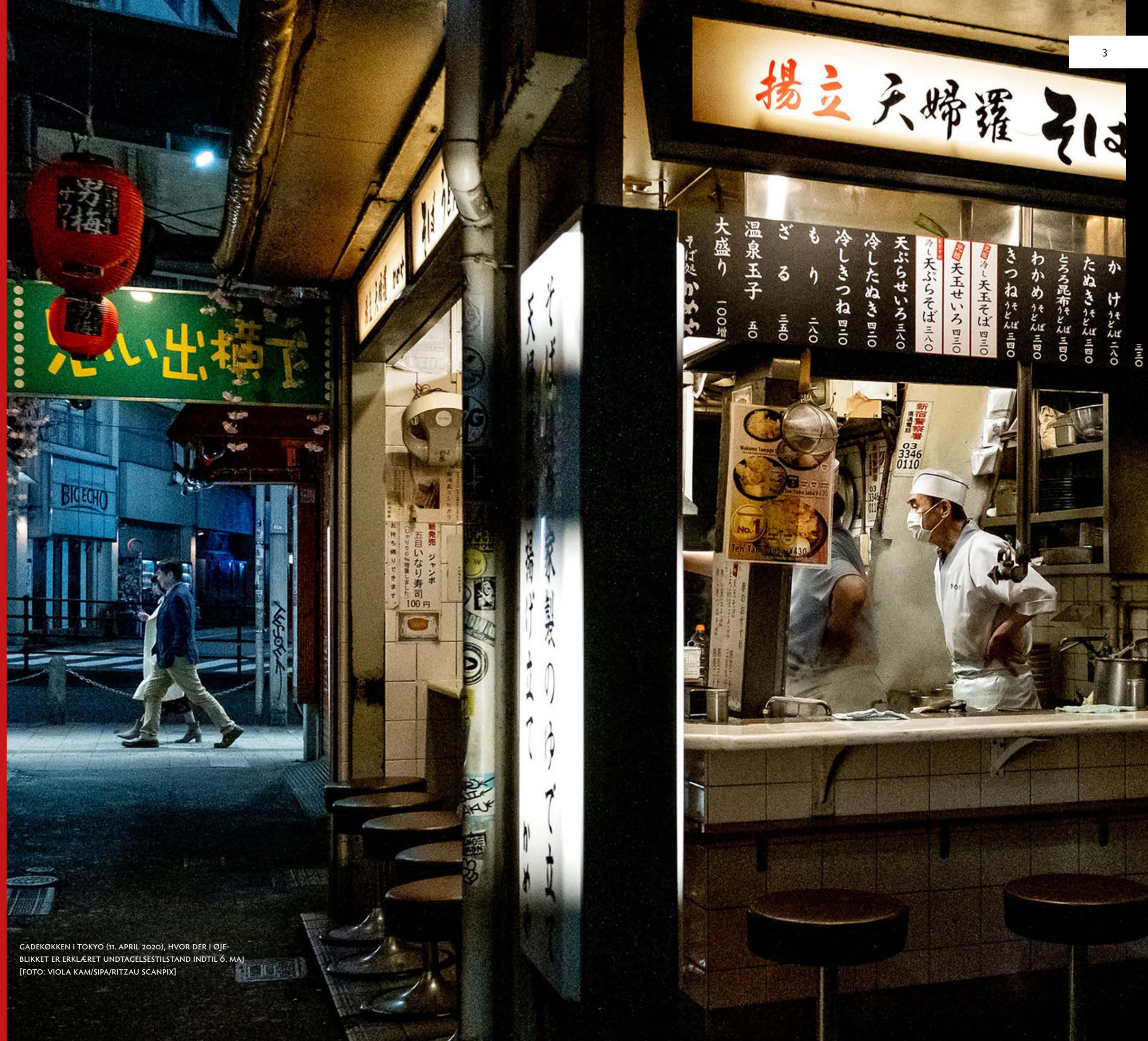
GADEKØKKEN I TOKYO (11. APRIL 2020), HVOR DER I ØJEBLIKKET ER ERKLÆRET UNDTAGELSESTILSTAND INDTIL 6. MAJ

12 MÅNEDERS ABONNEMENT: 250 KR. /200 KR. FOR STUDERENDE OG PENSIONISTER. SE: WWW.RÆSON.DK