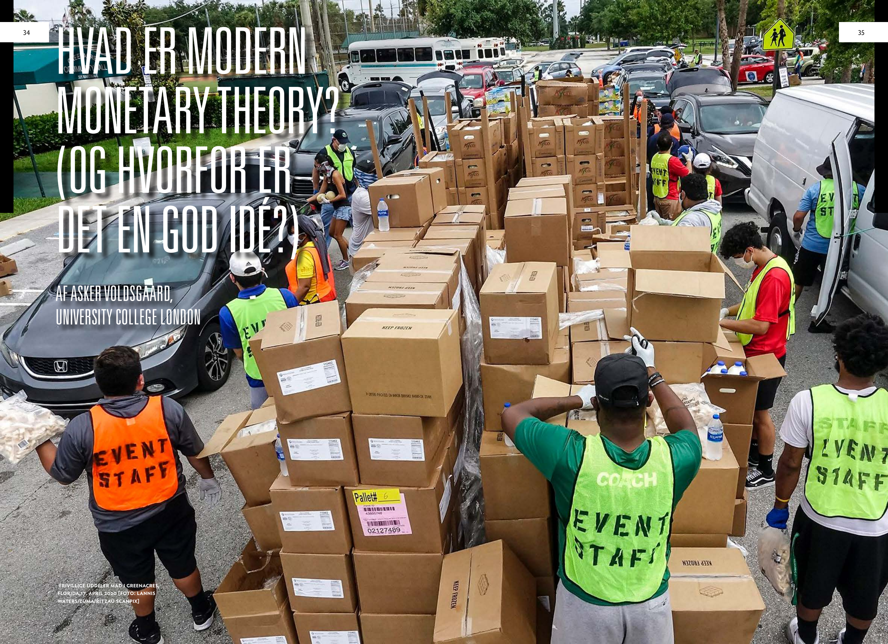
FRIVILLIGE UDDJELER MAD I GREENACRES, FLORIDA, 17. APRIL 2020

AF ASKER VOLDSPAARD, UNIVERSITY COLLEGE LONDON