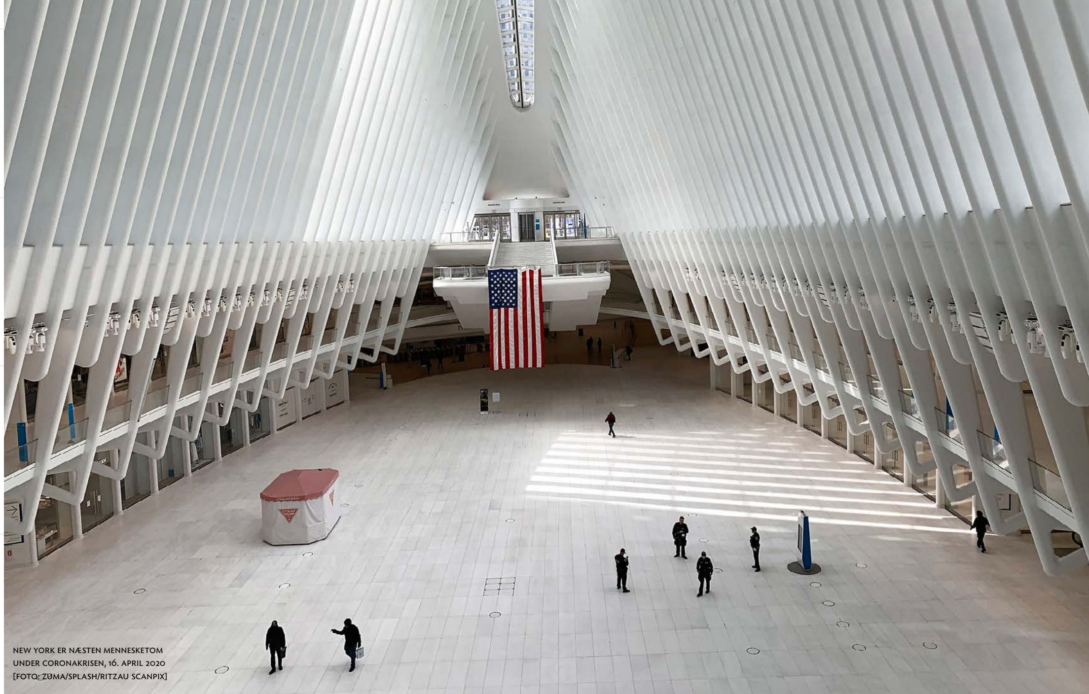
NEW YORK ER NÆSTEN MENNESKETOM UNDER CORONAKRISEN, 16. APRIL 2020

sammen og fokusere på sociale netværk. Ikke altid, ikke udelukkende, men generelt.