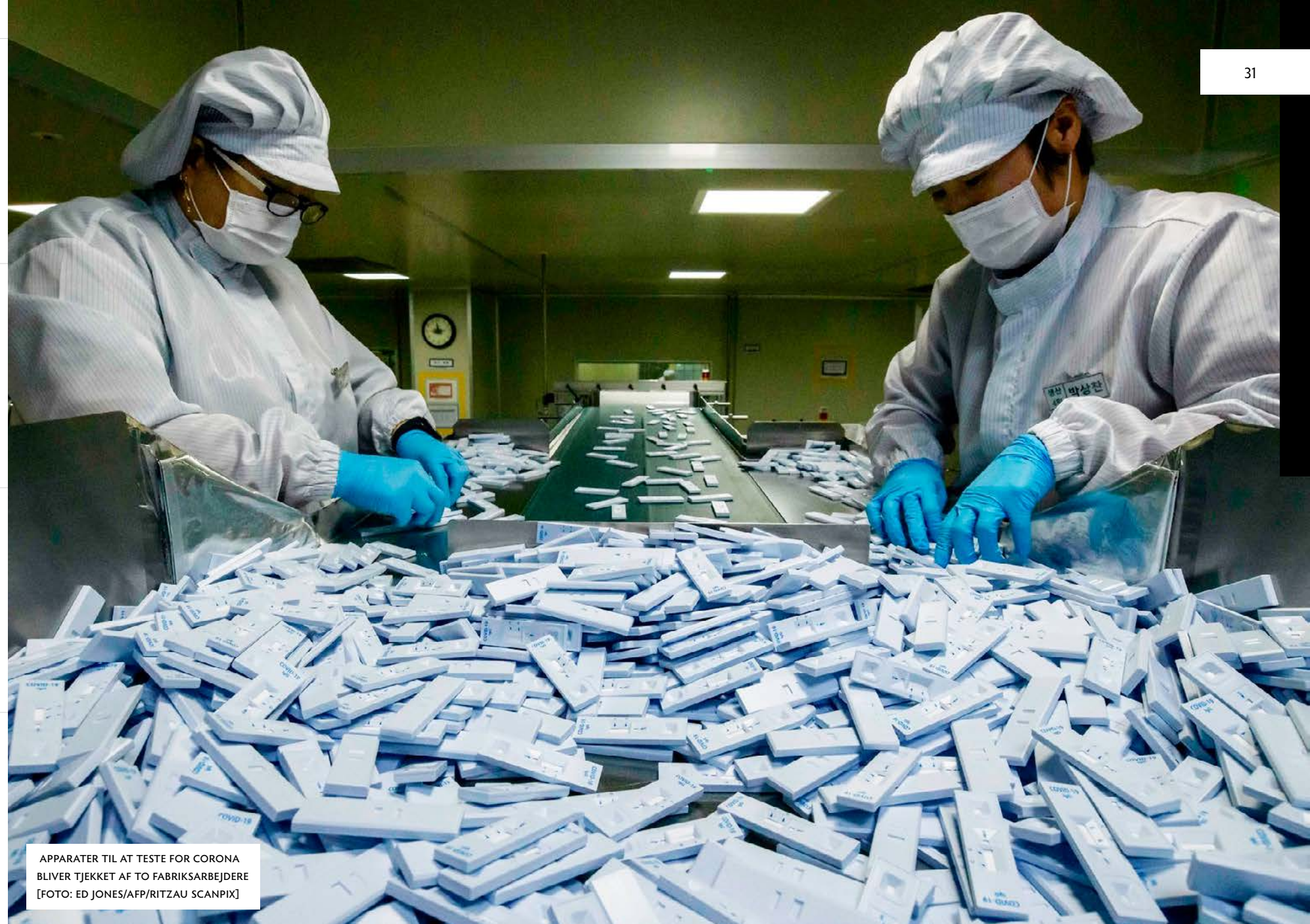
APPARATER TIL AT TESTE FOR CORONA BLIVER TJEKKET AF TO FABRIKSARBEJDERE

ASIATISKE LANDE HAR FULGT FORSKELLIGE STRATEGIER I BEKÆMPELSE AF DEN NYE CORONAVIRUS. MEN EN HØJ GRAD AF OVERVÅGNING AF BEFOLKNINGEN HAR — UANSET HVOR DEMOKRATISK ELLER AUTORITÆRT ET SYSTEM MAN HAR — SPILLET EN AFGØRENDE ROLLE