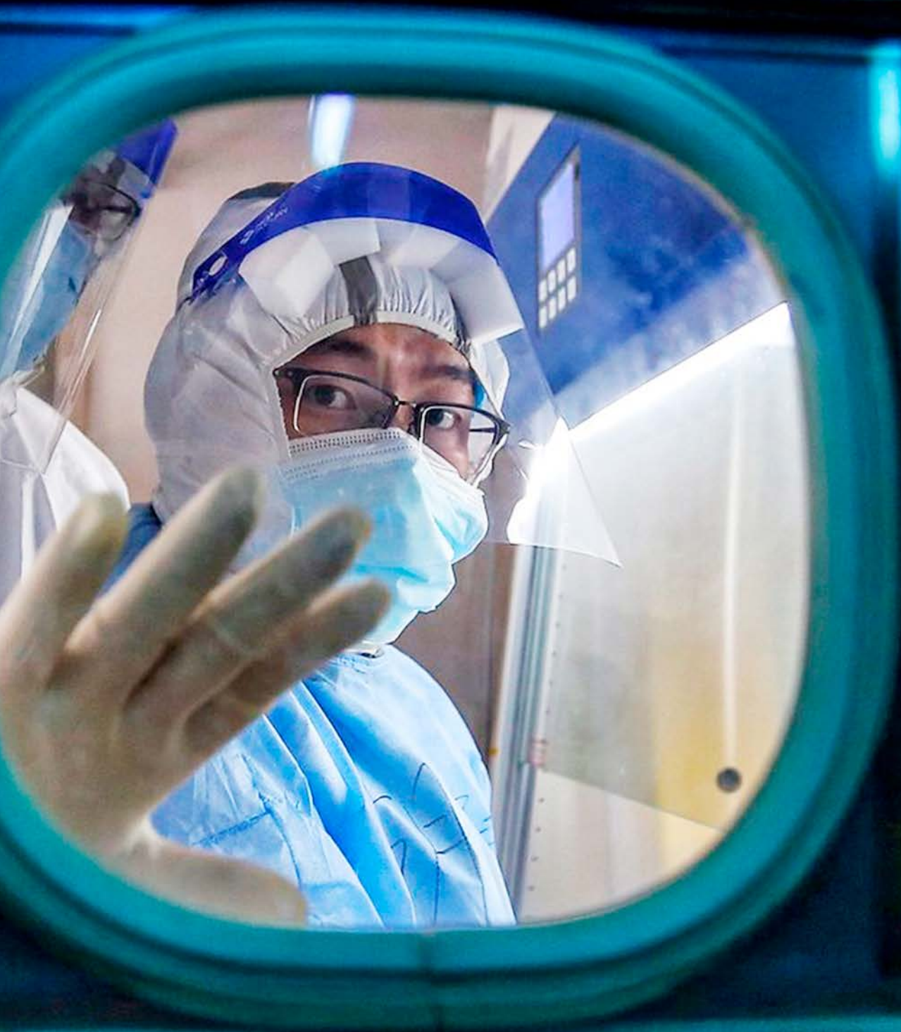
ET MEDLEM AF DET MEDICINSKE PERSONALE PÅ RED CROSS HOSPITAL I WUHAN LÅVER FACTER FRA EN ISOLATIONSADFDELING, 10. MARTS, 2020