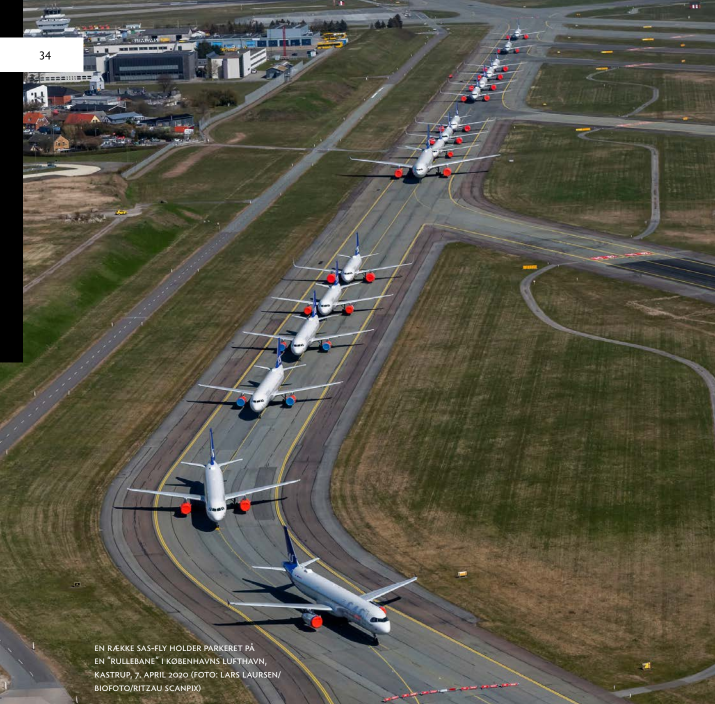
EN RÆKKE SAS-FLY HOLDER PARKERET PÅ EN "RULLEBANE" I KØBENHAVNS LUFTHAVN, KASTRUP, 7. APRIL 2020

sociale medier, fortælle hinanden, hvad der er den rette opførsel. De unge kan ikke opføre sig ordentligt, udenlandske arbejdere er sikkert smittebærere, folk går for tæt, når de går tur, og ja, listen er uendelig. Der skulle EN krise til, så transformerede Nordens italienere sig til en krydsning mellem sovjetborgere og repræsentanter for den hellige invasion. Vi udviser samfundssind, og vi er ovenikøbet gode til det. Men vi skal måske holde op med at fortælle andre mennesker og lande, at min og vores måde at gøre det på er den eneste rigtige. Og måske skal vi holde op med at hygge os over, at der dør langt flere i Sverige end i Danmark, når de nu har været så