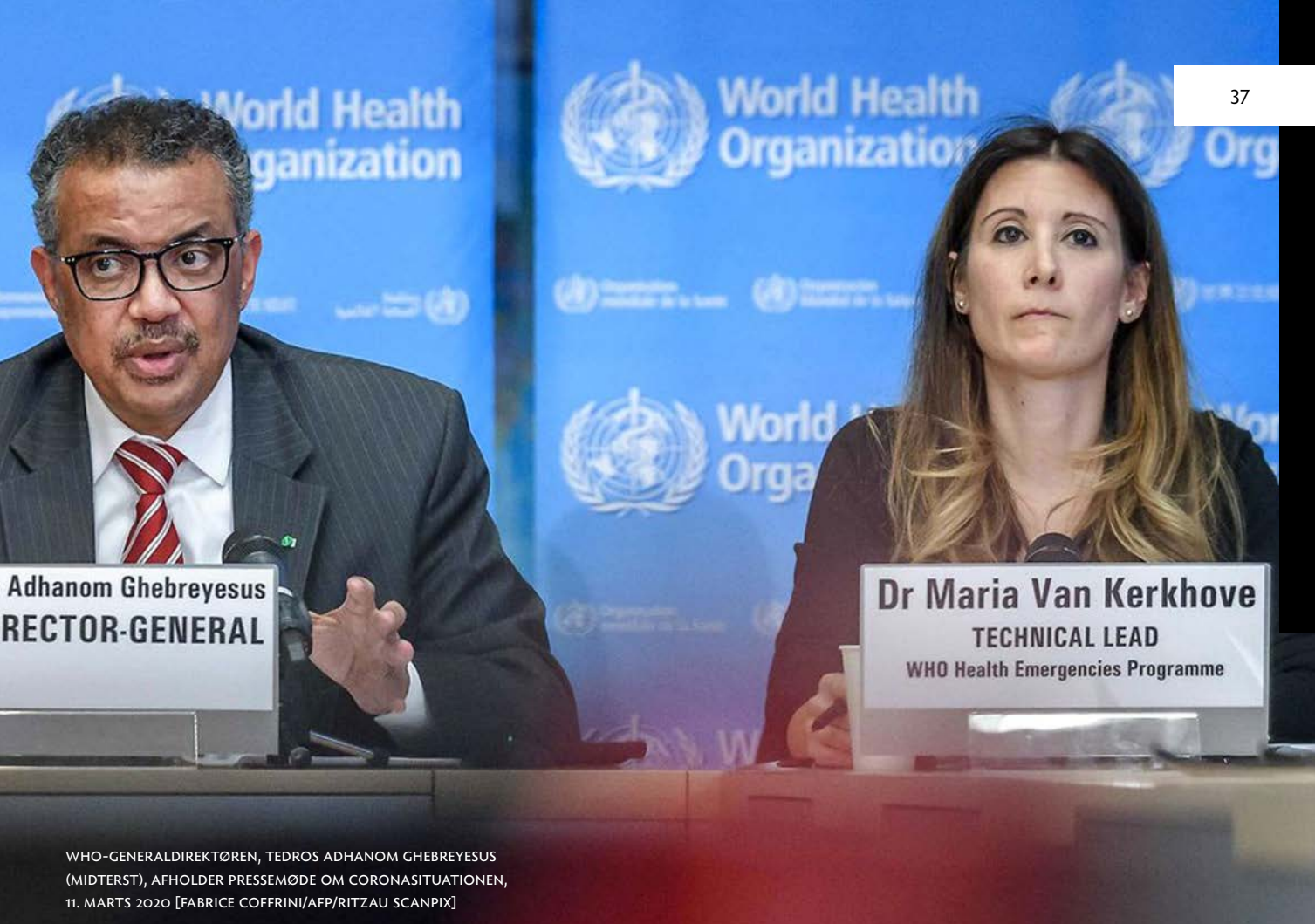
WHO-GENERALDIREKTØREN, TEDROS ADHANOM GHEBREYESUS (MIDTERST), AFHOLDER PRESSEMØDE OM CORONASITUATIONEN, 11. MARTS 2020

LIGESOM TRUMP NU ANKLAGER WHO FOR AT VÆRE INFILTRERET AF KINESISKE INTERESSER, BLEV WHO ALLEREDE FRA SIN OPRETTELSE EFTER ANDEN VERDENSKRIG ANKLAGET AF BÅDE USA OG SOVJETUNIONEN FOR AT STØTTE DET ENE VERDENSSYN FREMFØR DET ANDET. DET ER DET SAMME SKUESPIL MED SAMME MANUSKRIFT, MEN MED NYE KULISSER, DER NU GENOPFØRES MELLEM USA OG KINA. IGEN BEFINDER WHO SIG SOM PRYDELKNABE MELLEM TO STORMAGTER