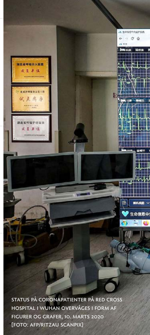
STATUS PÅ CORONAPATIENTER PÅ RED CROSS HOSPITAL I WUHAN OVERVÅGES I FORM AF FIGURER OG GRAFER, 10. MARTS 2020

Tyskland arbejder intensivt med kontaktsporing, og den amerikanske