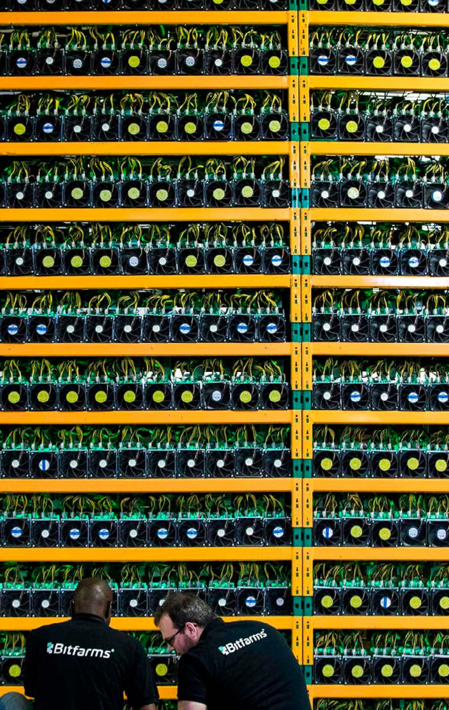
TEKNIKERE PÅ EN "BITFARM", DER BRUGER BLOCKCHAIN-TEKNOLOGI I SAINT HYACINTHE, QUEBECON, 18. MARTS 2018.

tere. Internettet spredte de enkelte punkter for afsendere og modtager af data i det gamle hierarkisk opbyggede kommunikationsnetværk (med én kommandocentral) ud i et nyt distribueret netværk af punkter med ligeværd, hvor nogle dog med Orwell's udtryk er mere lige end andre. Cloud computing centraliserede så igen computerkraft og opbevaring af data ved at placeret det på få enorme serverfarmes. Og der er vi i dag.